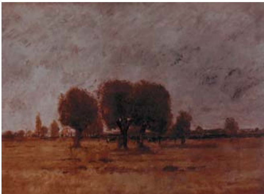
László Paál: Tempo nuvoloso, 1871

Il quadro è un insieme armonioso di colori scuri e chiari leggermente smorzati, tra i quali risalta solo il bianco del muro della casa al centro. Questo quadro rompe con ogni sorta di accademismo. Al centro della composizione spicca un albero dalla chioma scura e il muro bianco di una casa. Disposti nella zona centrale del quadro ci sono gli alberi carichi di fronde e il tetto della casa. Il quadro si conclude con la fascia chiara del cielo la cui limpidezza è spezzata dalla chioma scura di una betulla. Il motivo insignificante della casa e dintorni, della vecchia dalla schiena curva e dai passi malfermi abbellisce l'atmosfera fiabesca del quadro. Il dipinto, un tempo attribuito a Courbet, dimostra il suo valore indubbio, anche se nulla del quadro rimanda a Courbet,