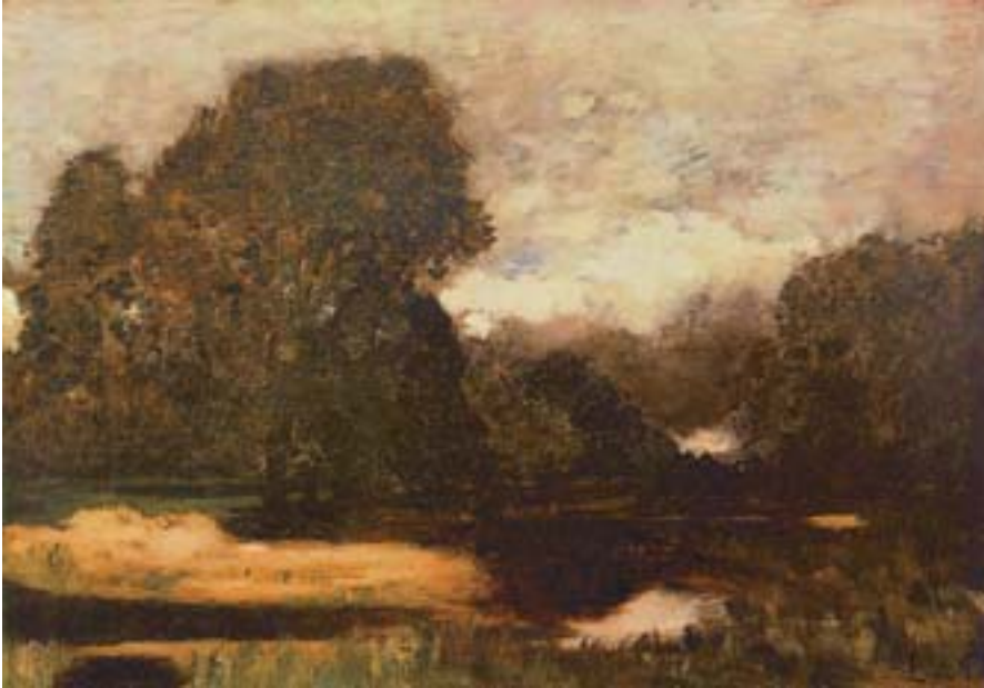
László Paál: Lo stagno delle rane

a parte la pennellata larga. L'influenza di Courbet su Paál non fu più determinante di quella dei maestri olandesi, di Munkácsy e dei pittori di Barbizon. Da questo capolavoro si capisce perché Paál venne considerato il pittore degli umori, il che cela un duplice significato: il pittore esprime l'atmosfera del paesaggio e il proprio umore: il fenomeno esterno viene trasformato in una visione intrinseca. Nel Borús idő ( Tempo nuvoloso ) dipinto nel 1871 ci troviamo davvero di fronte alla gamma multicolore del tempo nuvoloso. Il grigio metallico delle nuvole, il giallognolo del prato umidiccio, la macchia verde scuro degli alberi e le colline sullo sfondo che dividono in due il piano del quadro danno piuttosto l'idea di un paesaggio dopo la tempesta. Il motivo principale è la solitaria triade degli alberi strappati dal bosco, ammantati sotto il cielo plumbeo nella loro desolazione. L'inconsolabile grigiore della giornata esprime lo sconforto, la tristezza e lo stato d'animo dell'artista lontano dalla sua terra natia.