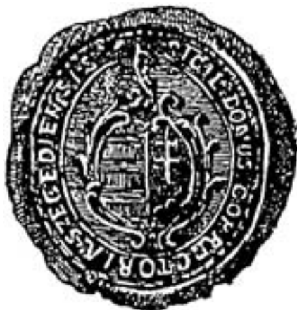
Timbro del penitenziario di Szeged del 1789

pienze. La conseguenza era che il reo veniva messo a rapporto al cospetto del direttore, che avrebbe, in seguito, determinato la punizione secondo la legge marziale.