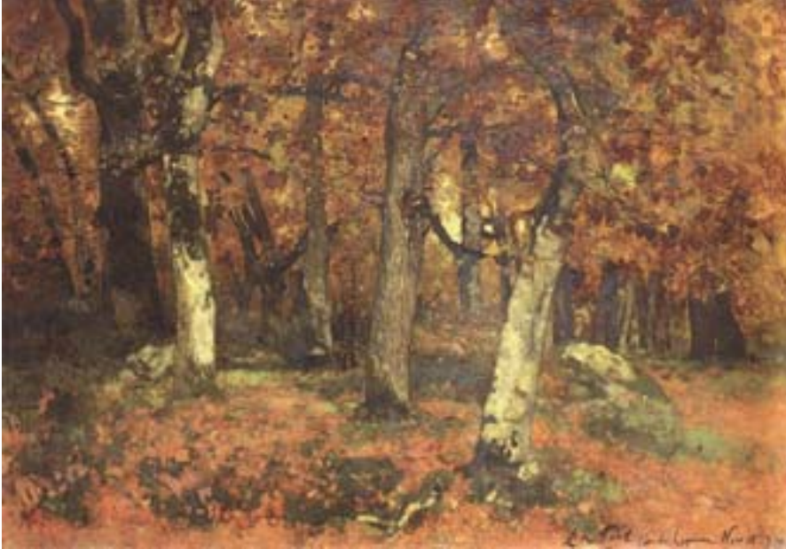
László Paál: Il profondo del bosco

viene approfondito con una forza più intensa e con una carica espressiva maggiore. Elimina completamente dalla sua opera i particolari superflui. Con tale semplificazione strutturale mette in evidenza la sostanza. Nella sua pittura disegno e colore, contenuto e forma non sono cose separate, ma formano un insieme omogeneo. Il fascino delle opere eseguite a Barbizon, che esprimono il suo umore, è superiore a quello delle opere precedenti. I suoi colleghi ne riconoscono la grandezza, in primo luogo Millet, secondo il quale Paál fu uno dei talenti più originali tra i pittori che operarono a Barbizon. Uno dei primi dipinti di questo periodo è Erdő mélye ( Il profondo del bosco ) realizzato nell'autunno del 1873. Quest'opera è una visione autunnale della realtà naturale. Il quadro è dominato da un gruppo di tre alberi assolti in primo piano che contrastano con lo scudo degli alberi che fanno da sfondo. Con Holdfeljötte ( Il sorgere della luna ) esposto in un salone a Parigi nel 1875, attirò su di sé l'attenzione della critica. Nel numero del 27 febbraio del 1875 de L'Art, il critico Paul Leroy scriveva: