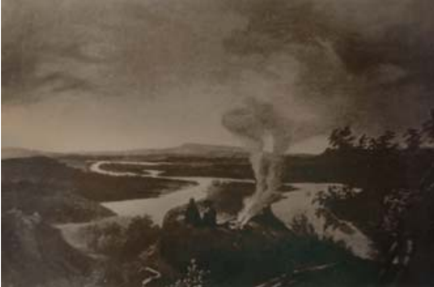
László Paál: Tramonto sul Maros, 1864. Museo Janus Pannonius, Pécs

le foreste e i paesaggi della Transilvania, per l'atmosfera tranquilla e la bellezza dei boschi della sua terra. In questo paesino incominciarono ad affiorare le sue doti artistiche, si conoscono circa quaranta opere di questo periodo. Gli studi e gli abbozzi eseguiti in Olanda dimostrano il livello raggiunto e la sensibilità ai diversi temi della natura. Uno dei primi dipinti di Beilen, Dél (Mezzogiorno) , colpisce lo spettatore con la semplicità del tema: è una visione tranquilla e serena della realtà naturale e agreste, nel quadro non vi sono contrasti tra gli elementi che lo compongono, il paesaggio descritto è quasi fiabesco.