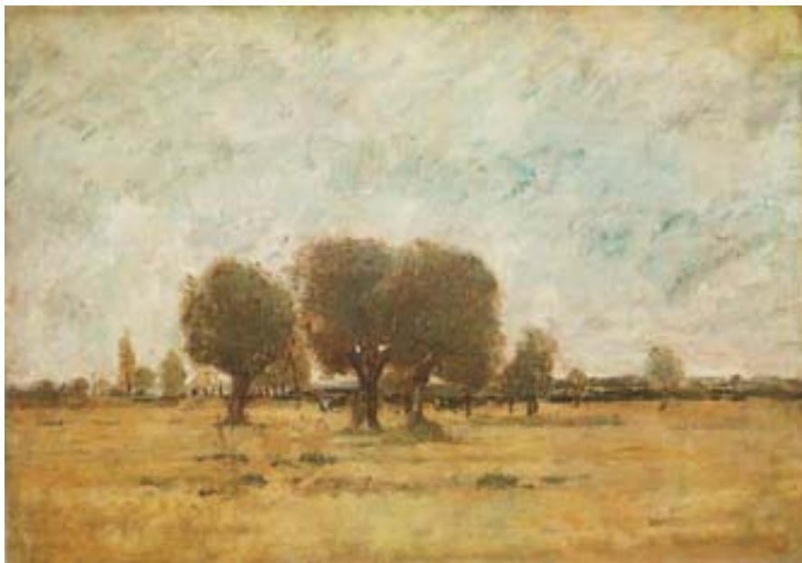
László Paál: Tempo nuvoloso

sviluppo si manifesta non solo nell'arricchimento dei temi, ma anche nell'immaginazione e nella tecnica pittorica. Tutta l'opera di Paál prende spunto dalla contemplazione della natura. «Avrei voluto diventare poeta – scrive a Munkácsy – quando ho visto il mare per la prima volta, per poter esprimere con parole prolisse il sentimento che mi ha rapito: per molto tempo sono rimasto assorto nella magnifica visione». 3 Purtroppo non conosciamo i suoi dipinti relativi al tema del mare. Ritorna su questo argomento anche in una lettera scritta alla sorella Berta il 7 settembre 1871: